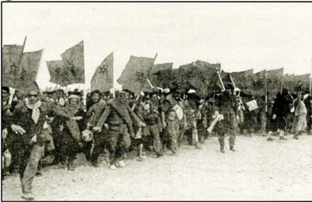
المسيرة الخضراء حدث وطني جليل في تاريخ المغرب الحديث