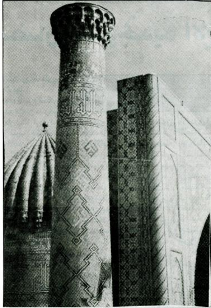
سمرقند، منظر لمدرسة «شير - دار». القرن 17