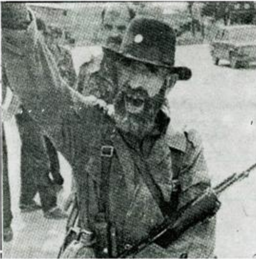
المستوطنات الاسرائيلية عقبه امام السلام