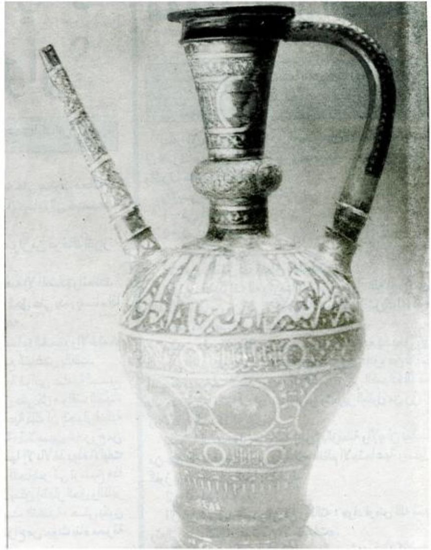
خفة من الصناعة الإسلامية