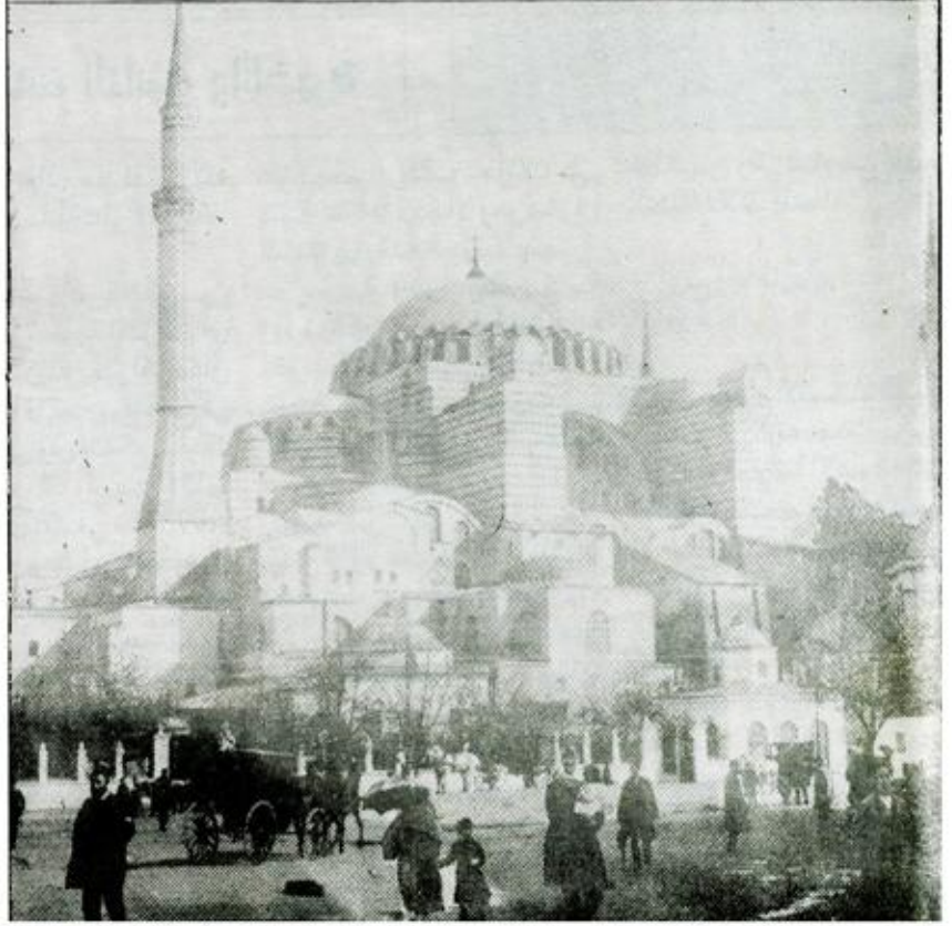
اسطنبول حين كانت عاصمة الدولة العثمانية