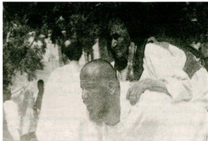
صورة لحاج يحمل امه وراء ظهره وهما يؤديان معا مناسك الحج

بسم الله الرحمن الرحيم (واخلف لهما جناح الذل من الرحمة وقل رب ارحمهما كما ربياني صبورا) صدق الله العظيم