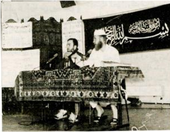
صورة لمحاضرة قيمة ألقاها الاخ الالماني الحسني الطيب الذي كان منذ امد قصير مدعنا للمخدرات ونقد