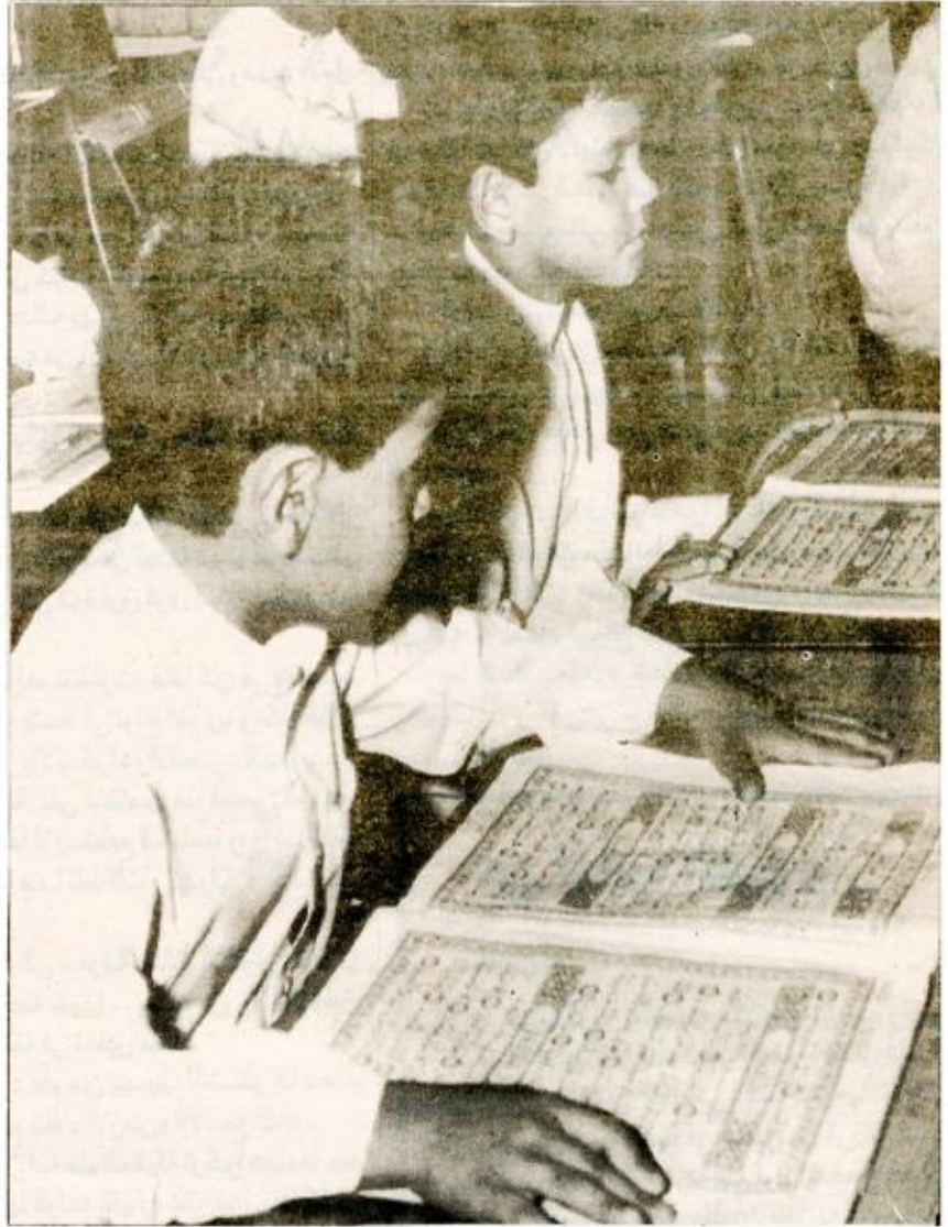
يحفظون القرآن الكريم منذ الصغر