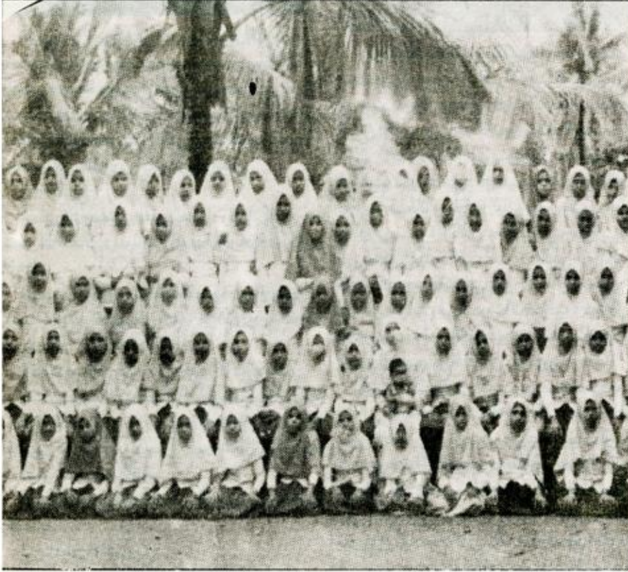
فتيات مسلمات من الفلبين