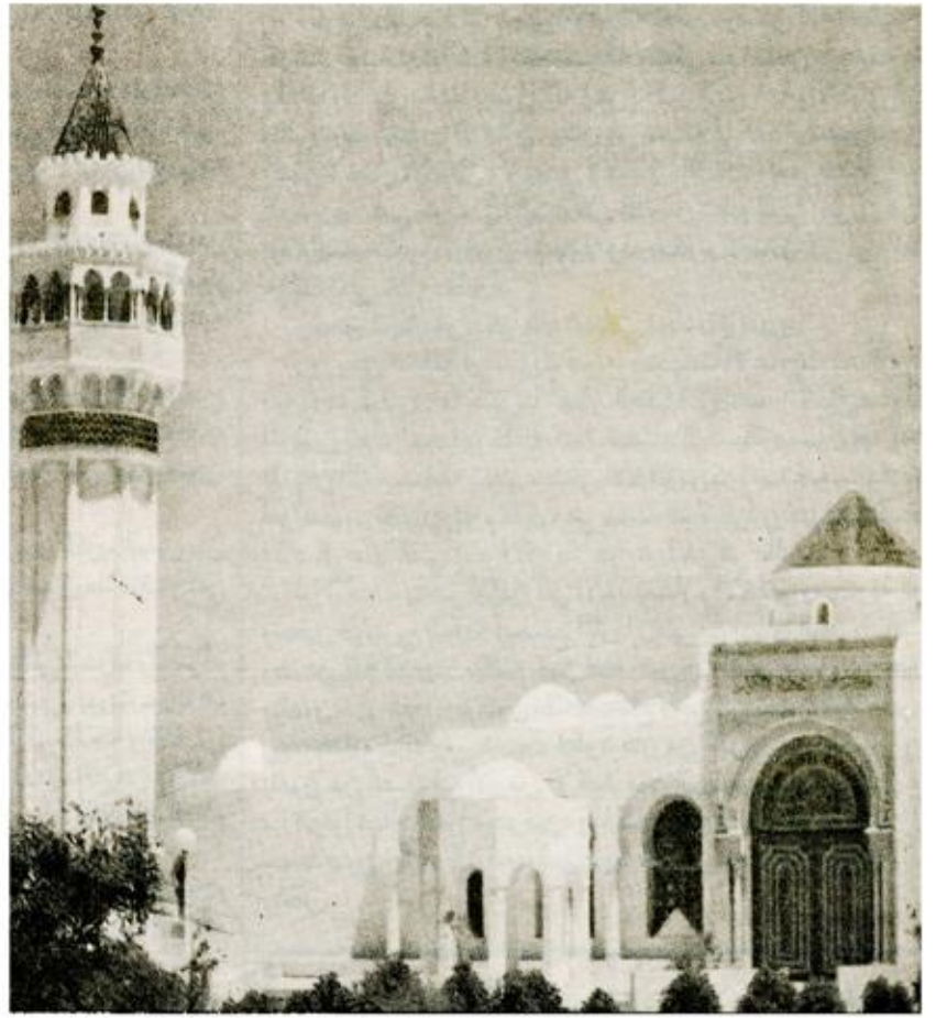
مسجد البحيرة - بتونس