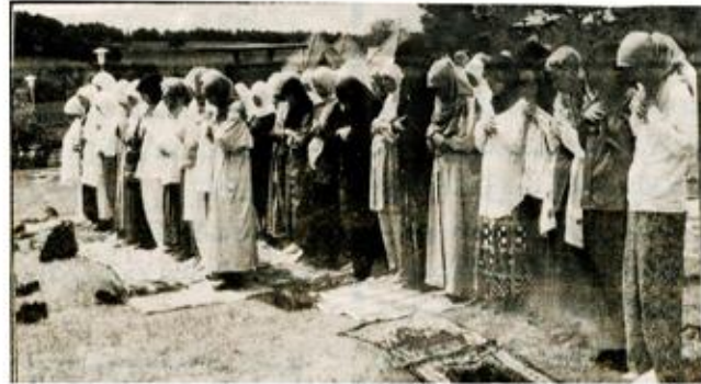
صورة لفتيات المانيات مسلمات وهن يؤدين الصلاة

يا ولدي يا وحيد إن لي تحوكة حبا شديد ورضائي دوما عليك لا ينقص بل يزيد أقربا مني كنت أم في مكان ناء بعيد فعليك كنت صبورا لحر الشمس وقمر الجليل ولك في جيدي أمانة كما هي في كل جيد أن أتهاك عن الخيانة وأعطيك النصيح السديد فأنت لا شك منه راو بل ومشتاق للمزيد فخذ ولا تقبل مواه وإياك عنه أن تحيد اتق الله مادمت حيا وكن له من خير عبيد ووحده ولا تعبد سواه فهو أحق بالتوحيد وكبره وأطلب رضاه وسبحه وأكثر التعميد وأتل كتاب الله بني دوما ورتلته واحسن لتجويد وصنقه في ما حواه لك من وعد أو وعيد فإنه لا بد أتيك يوم يكون فيه لك أو عليك شهيد ويصنع خير الخلق تمسك لا ترزع عنها أو تحيد وكن عنها خير مراعف ولأحكامها مجيد وكن في العلوم مجددا ولا ترض بالتقليد وكن في الدين مرنا ولا تتبالغ في التشديد واصبر لحكم الله دوما