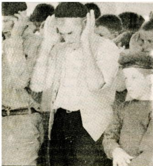
الاقليبة المسلمة اليوغسلافية تشترك في الحياة الوطنية

وبهذه المناسبة الأليمة يتقدم جميع جيرانها واحبابها بتعازيم الحارة الى كافة أفراد أسرة الفقيدة راجين من الله العلي القدير ان يتعدها برحمته الواسعة. وإنا لله وإنا إليه راجعون.