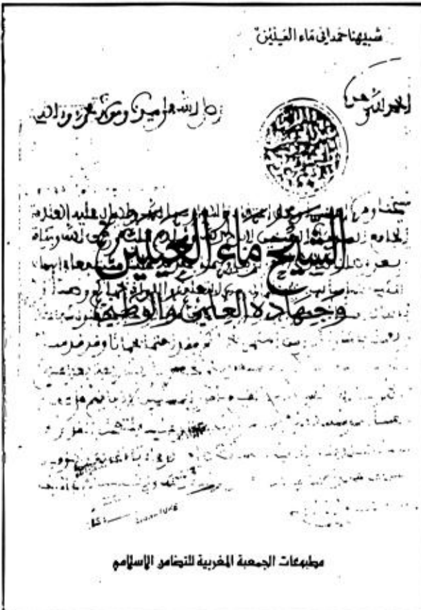
مطبوعات الجمعية المغربية للتضامن الإسلام

وتجدر الاشارة الى ان الجمعية اعلنت في هذا الحفل عن برنامج موسمها الثقافي الجديد الذي يتميز بالعديد من الأنشطة الهامة.