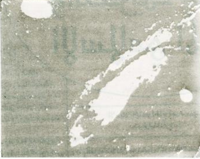
(خلق السموات والأرض أكبر من خلق الناس ولكن أكثر الناس لا يعلمون) غافر الآية 57

محدودة. فهذه القدرة لم تنشأ صدفة بل هي تخضع لنظام معلوم وموزون وهذه القدرة الجليلة فمسترتها الآية الكريمة: (إن الله بمسك السموات والأرض أن تزولا ولئن زالتا إن امسكهما من أحد من بعد إنه كان حليماً غفوراً) فاطر الآية 41 وهي ما يسميه العلم الحديث اليوم بالجاذبية الكرونية كما أن هناك عدة حقائق كونية أخذت تنكشف للعيان وأصبح الإنسان يراه بأب عينيه وكلما تطور العلم إلا وزاد التحقق من عظيم آيات الله في الكون يقول تعالى: «حتى يروا صنع الله الذي اتقن كل شيء» النمل الآية 88 فكل شيء يسير وفق نظام معين ومضبوط وفق انسياب بدیعة ومتكاملة فهناك في الكون أكثر من مائة مليار مجرة، وحدود الكون الحالية وأبعد نقطة مكتشفة فيه حالياً يقدرها علماء الفلك المحدثون ب 15 مليار سنة ضوئية، وهذه المسافة الهائلة لهي من تعداد الخيال حيث أن هذه الشمساعة التي يتشكل منها الكون، جعلت لغاية معينة وهي أنها تسير إلى غاية وأجل مسمى فهذا الخلق، أي خلق السموات والأرض، تعد من آيات الله، يقول تعالى: (ومن