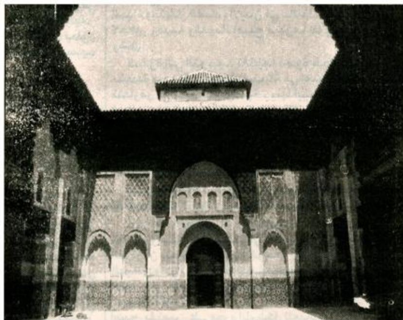
حضارة الإسلام في الأندلس هي أحد أوجه الحوار بين العالمين الإسلامي والغربي

بمشاركة عشرات المفكرين والعلماء والخبراء والباحثين من العالمين الإسلامي والغربي رعت جامعة أكسفورد ندوة فكرية موضوعها «عولمة الثقافة وانعكاساتها على العالمين الإسلامي والغربي». وقد تركزت أعمال الندوة التي نظمتها مركز الدراسات الإسلامية في جامعة أكسفورد حول سبل التعاون بين الهيئات الثقافية والأكاديمية الغربية والإسلامية أولا لتنظيم الحوار حول قضايا المصير الإنساني والثقافي المشترك وثانيا حول مناهج وسبل التعامل مع التطور الحديث في حقول المعرفة والمعلومات. وفي كلمة للدكتور عبد العزيز بن عثمان التويجري مدير عام المنظمة الإسلامية للتربية والعلوم والثقافة «اييسيسكو» الذي شارك في الندوة قال فيها : أن المناقشات والحوار بين العالمين الإسلامي والغربي أكدت تميز الثقافة الإسلامية وقدرتها على المساهمة الفاعلة في بناء الحضارة الإنسانية المعاصرة وقدرتها على التفاعل مع الثقافات الأخرى أخذًا وعطاء. وأبرز أن تجربة الحوار بين الهيئات الأكاديمية والثقافية الإسلامية والغربية أكدت تجدد الثقافة الإسلامية مواكبتها للتطورات معتبرا أن طبيعة الثقافة الإسلامية وكونيتها جعلتها لا تذوب في نظام ثقافي عالمي، وتبين أن جانبها كبيرا من الصور التي تحملها الدوائر الغربية عن الإسلام غير صحيحة تساهم في تكوينها دوائر مغرضة تجعل صورة الإسلام منفرقة وترتبط بالإرهاب والعنف. وأكد في هذا الصدد أن التعاون بين اييسيسكو ومنظمة المؤتمر الإسلامي قائم من أجل بلورة خطة شاملة لتصحيح صورة الإسلام في الغرب، وذلك في إطار الاجتماعات التي عقدت بالرباط وجدة برعاية منظمة المؤتمر الإسلامي لاعداد استراتيجية إسلامية لتصحيح صورة