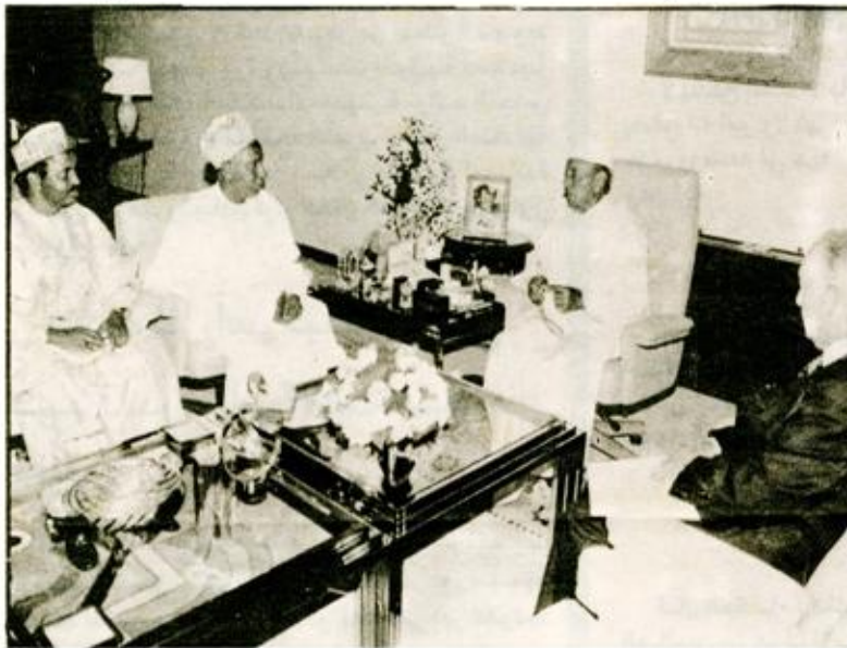
استقبل صاحب الجلالة الملك الحسن الثاني مساء يوم الأربعاء 30 غشت 1995 بالقصر الملكي بالصحيرات السيد حامد الغابدي الأمين العام لمنظمة المؤتمر الإسلامي الذي كان مرافقاً بالسفير عثمان موطاري ممثل الأمين العام للمنظمة لدى جلالة الملك. حضر هذه المقابلة مستشار صاحب الجلالة السيد عبد الهادي بو طالب.