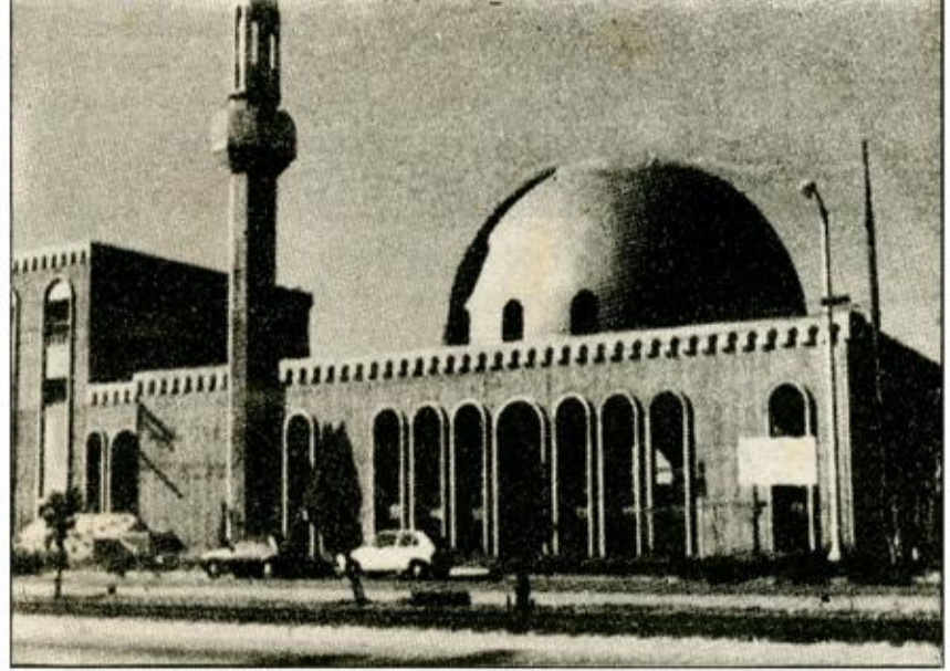
مسجد عمر بن الخطاب في «لوس انجليس»