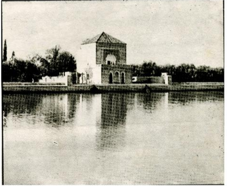
منظر جميل للمنارة بمراكش