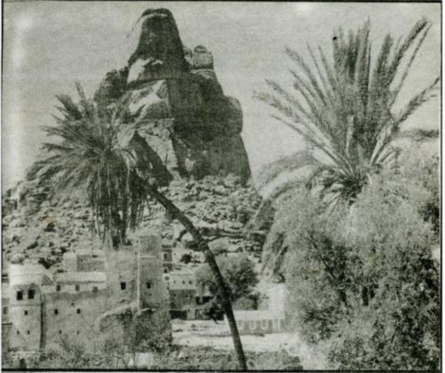
جمال الطبيعة بمدينة تفراوت