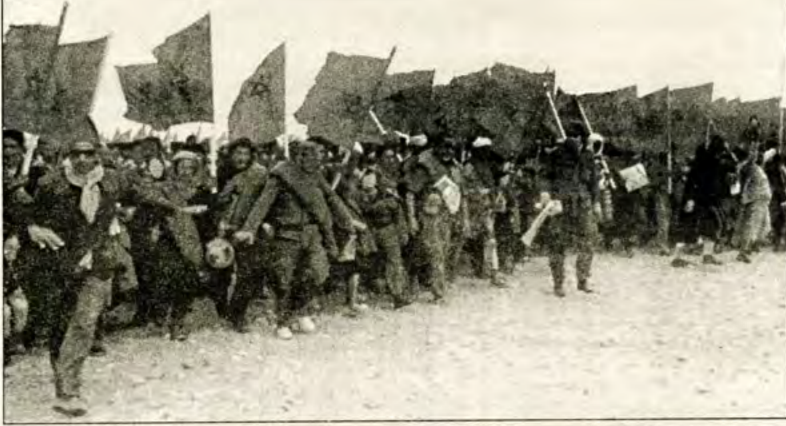
المسيرة الخضراء حدث وطني جليل في تاريخ المغرب الحديث