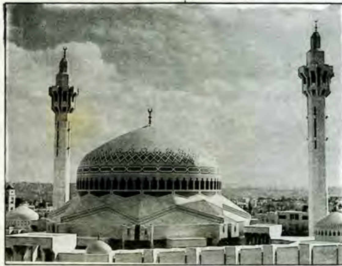
أحد مساجد عمان بالأردن