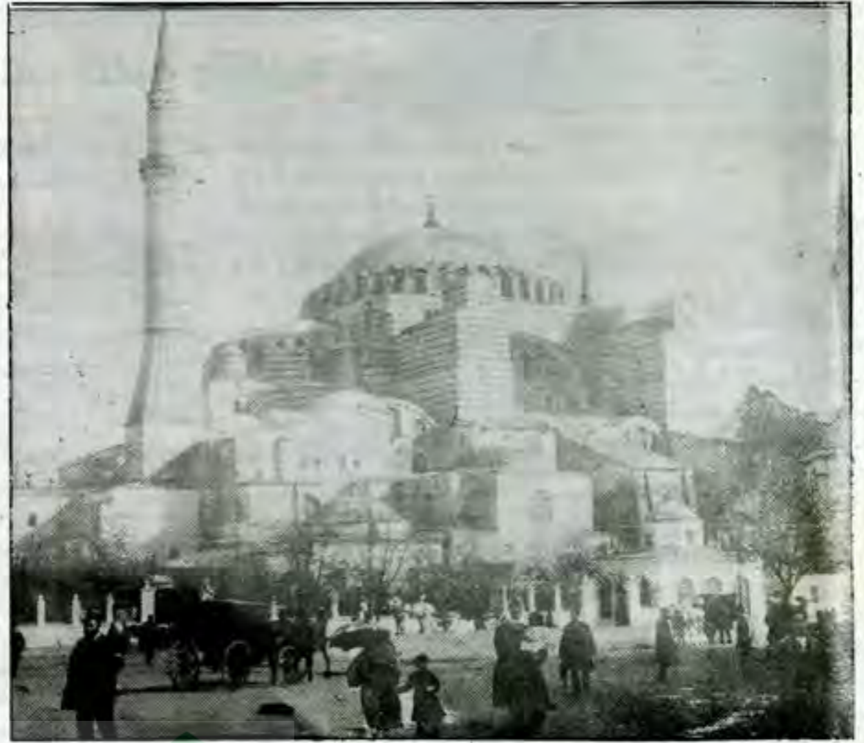
اسطنبول حين كانت عاصمة الدولة العثمانية