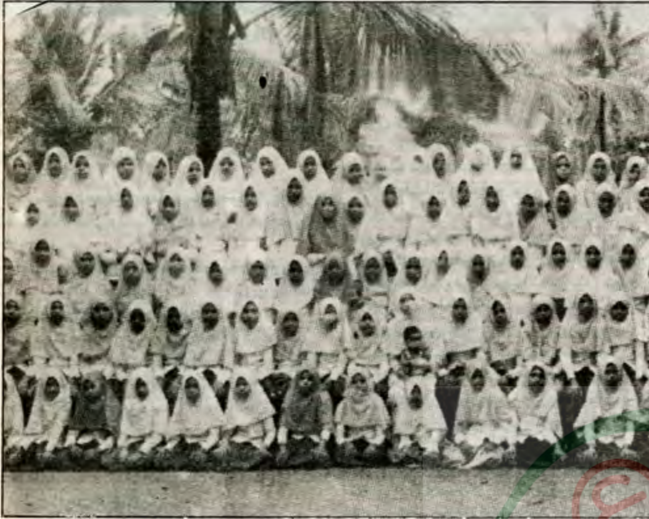
فتيات مسلمات من الفلبين