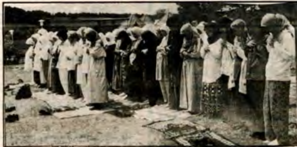
صورة لفتيات المانيات مسلمات وهن يؤدين الصلاة

وكن بني شهما شجاعا وإن كنت في سياج من حديد وإن كان لك في الموت خيار فاختر أن تموت شهيد واجتنب بني كل مخدر ولا تقرب أي خمر أو نبيد فهي أشياء لعقلك ضارة ولجسمك بني لا تفيد فهي له قاتلة إن لم تكن شر مبيد واحذر بني ذلك اليوم الذي ندامة المرء لا تجدي ويكأؤه لا يفيد يوم يقال لجهنم هل امتلأت فتقول هل من مزيد ولا تترك لحبال الشيطان يوما فرصة لتلهو بك أو تكيد وكن لنفسك بني دوما عدوا ولهواك بني عاص عنيد ولا يهكم نعت العدى لك بالغبي أو البليد أو قولهم بأنك للرقصات في الحانات لا تحسن أو تجيد فمن نهج أبائك وأجدانك وسنة نبيك بني لا، لا، لا تحيد ومن الحضارة خذ ما هو لك مهم ولدينك وبلدك مفيد وتق بأنك إن فعلت فأنت الحليم وأنت الرشيد