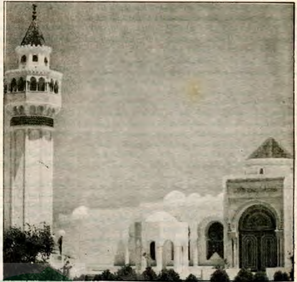
مسجد البحيرة - بتونس