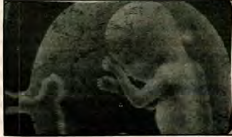
(الذي خلقه فسواك فعلك في أي صورة ما شاء ربك) الانفطار (8،7)

بسم الله الرحمن الرحيم (يا أيها الناس إن كنتم في ريب مما نبعث فإنا خلقناكم من تراب ثم من نطفة ثم من علقة ثم من مضغة مخلقة وغير مخلقة لنبين لكم ونقر في الأرحام ما نشاء إلى أجل مسمى) سورة الحج 5 (إنا خلقنا الإنسان من نطفة أمشاج نبتليه فجعلناه سميما بصيرا) (الإنسان 2) (ألم يك نطفة من مني يماني ثم كان علقة فخلق فمسوى فجعل منه الزوجين الذكر والأنثى) القيامة 37، 38، 39