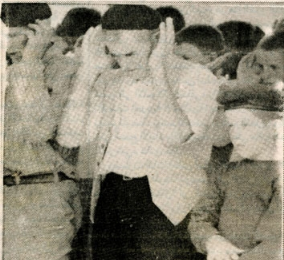
الاقلية المسلمة اليوغسلافية تشارك في الحياة الوطنية