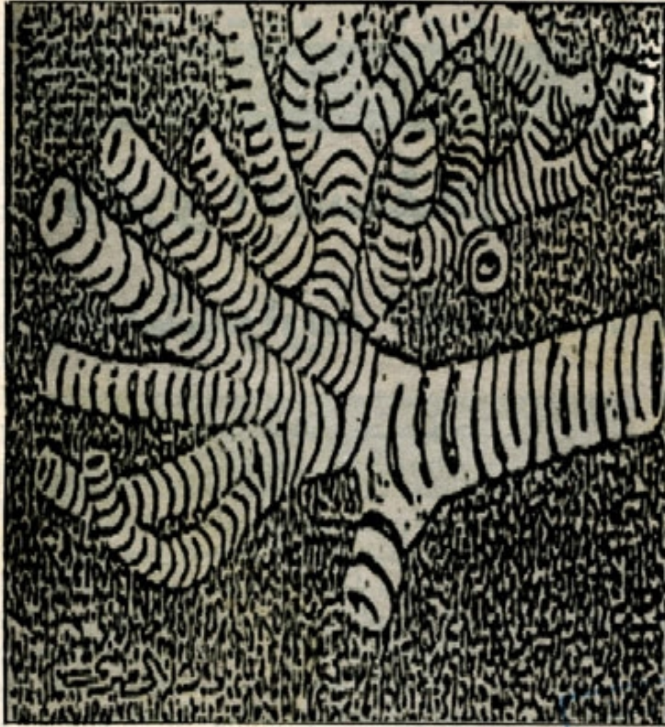
صورة بالكمبيوتر تمثل القصة الهوائية والرثة اليمنى في الانسان وهي تشتمل على كلمة التوحيد ( لا إله إلا الله محمد رسول الله )