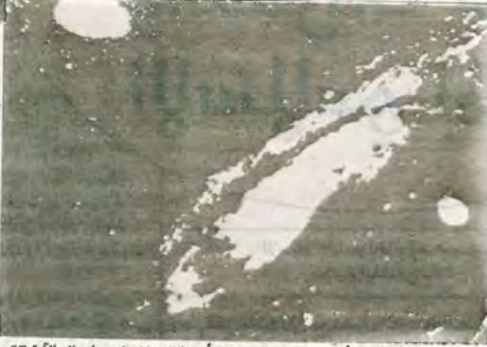
(خلق السموات والأرض أكبر من خلق الناس ولكن أكثر الناس لا يعلمون) غافر الآية 57

فهذا الكون الشاسع الأطراف لم يبين إلا على الحق والأجل المسمى. قالبنا كان بالحق والحق ضده الباطل فلو كان الكون لم يتم على الحق وكان يقوم على الباطل لما كانت عنده هذه المواصفات والخصائص المميزة الحكمة فكم من ظاهرة كونية لا زالت مستعصية على الفهم والإدراك. فهناك شروح جاء بها العلم الحديث وهي متعددة وأحياناً متناقضة ولا تنسجم مع الدعائم والأسس التي انبني عليها الكون نفسه ولم يفسر لنا الغاية التي يسير إليها وفق هذا النظام المعلوم والمضبوط وحتى الأبعاد اللانهائية حصرتها الآية الكريمة (فلا أقسم بمواقع النجوم وإنه لاقسم لو تعلمون عظيم) الواقعة الآيتان 75-76