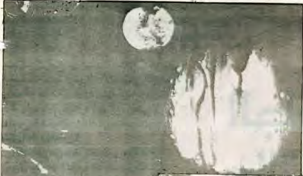
(وأية لهم الليل نسلخ منه النهار فإذا هم مظلون يغشي الليل النهار يطلبه حثيثاً). الأعراف الآية 54

(أأنتم، شدد خلقاً أم السماء بناها رفع سمكها فسواها واغطش ليلها واخرج ضحاها) - النازعات 27 - 29