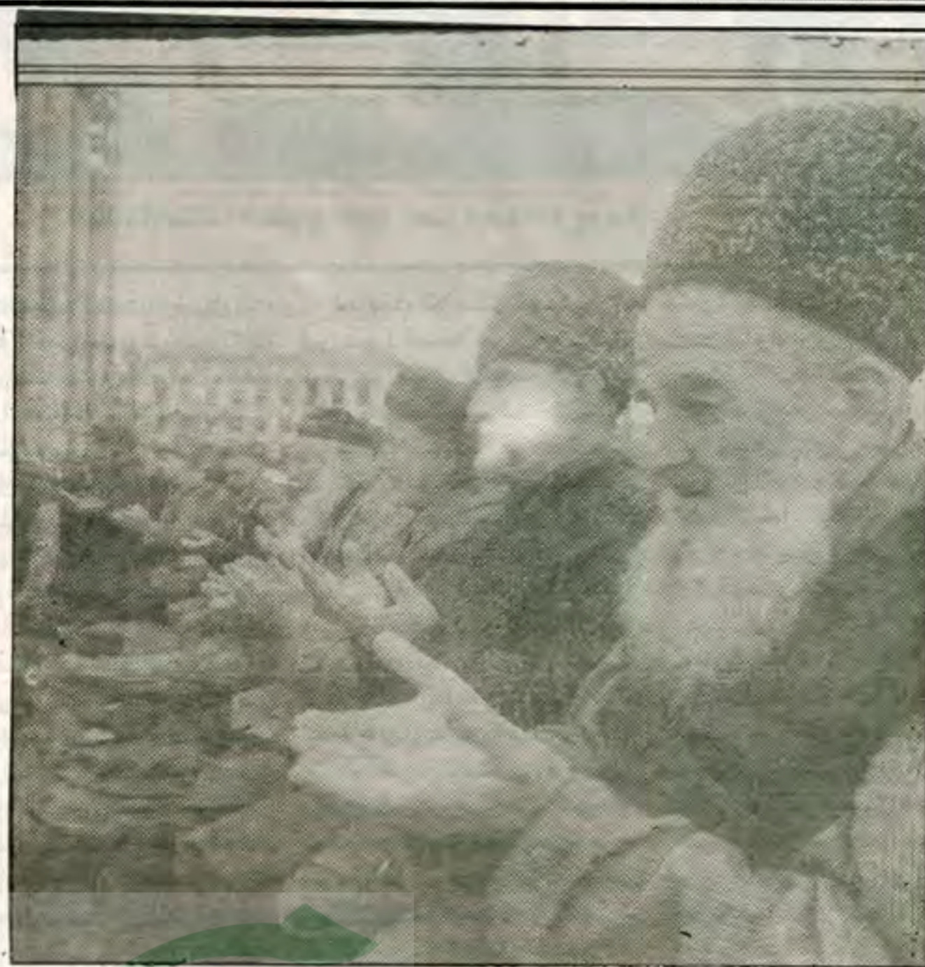
المقاومة الوطنية مستمرة في الشيشان