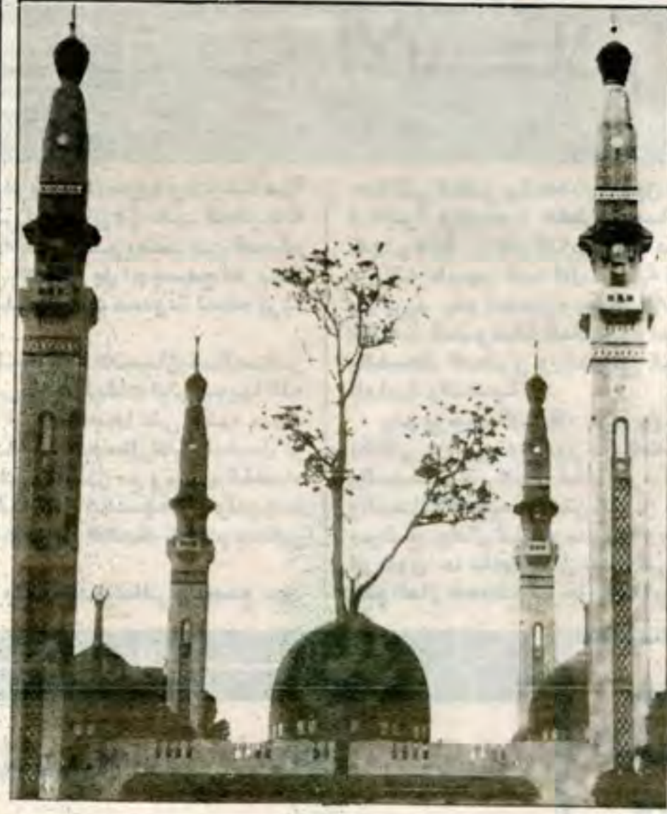
الدور التربوي للمساجد في المجتمعات الإسلامية