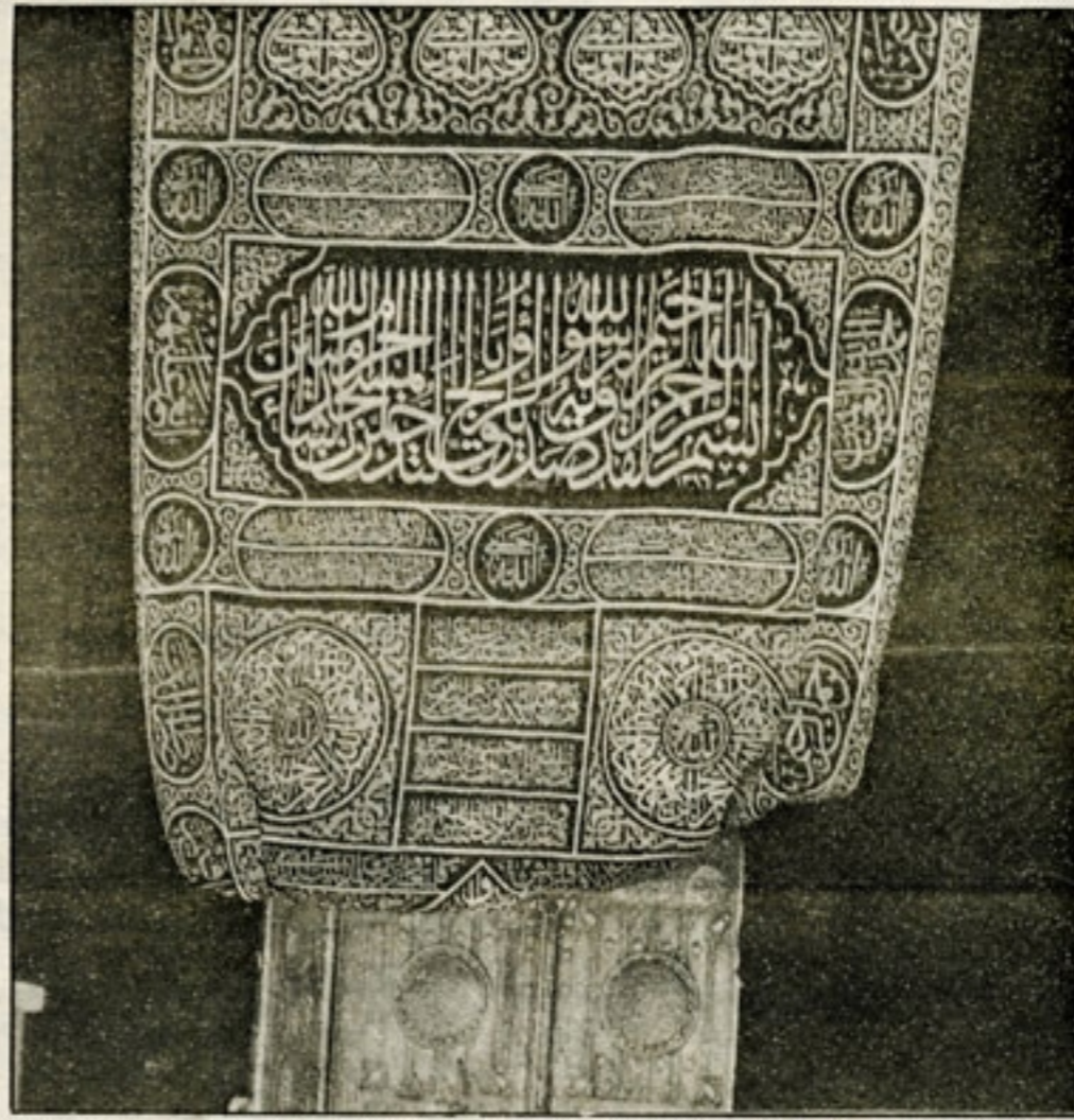
باب الكعبة المشرفة وعليه الستارة