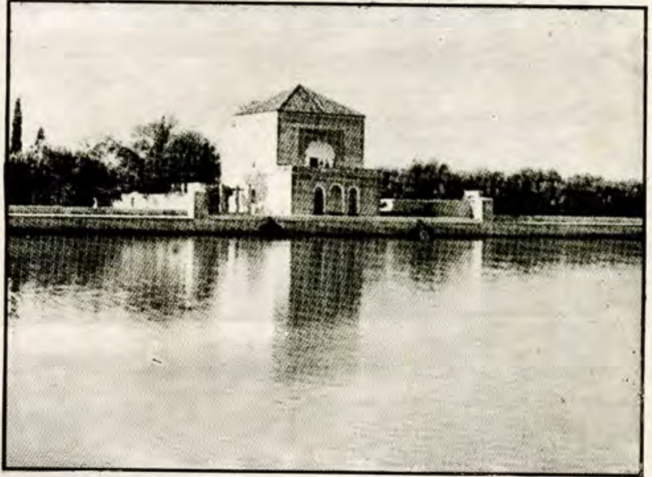
منظر جميل للمنارة بمراكش