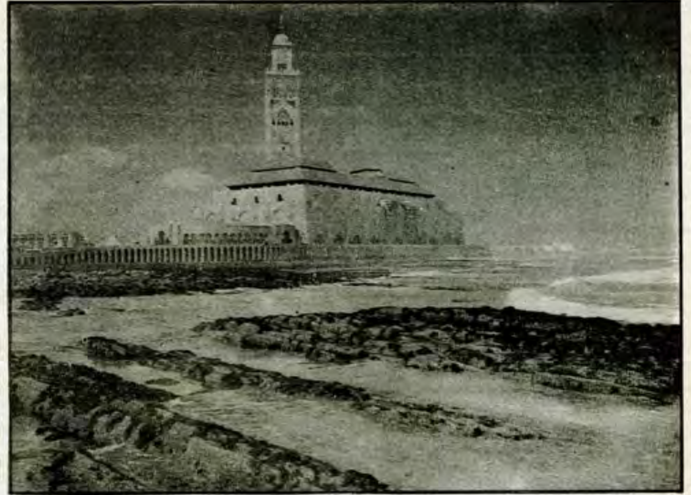
مسجد الحسن الثاني بالدار البيضاء وتبدو المئذنة التي يناهز علوها (200) متر