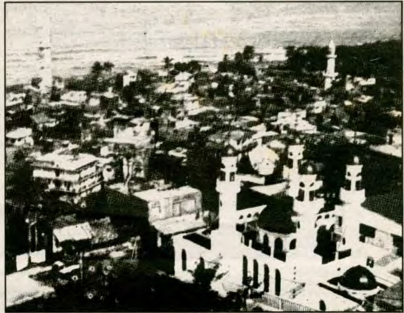
كثرة المساجد أحد ملامح العاصمة «مورونج» بالجزر القمر