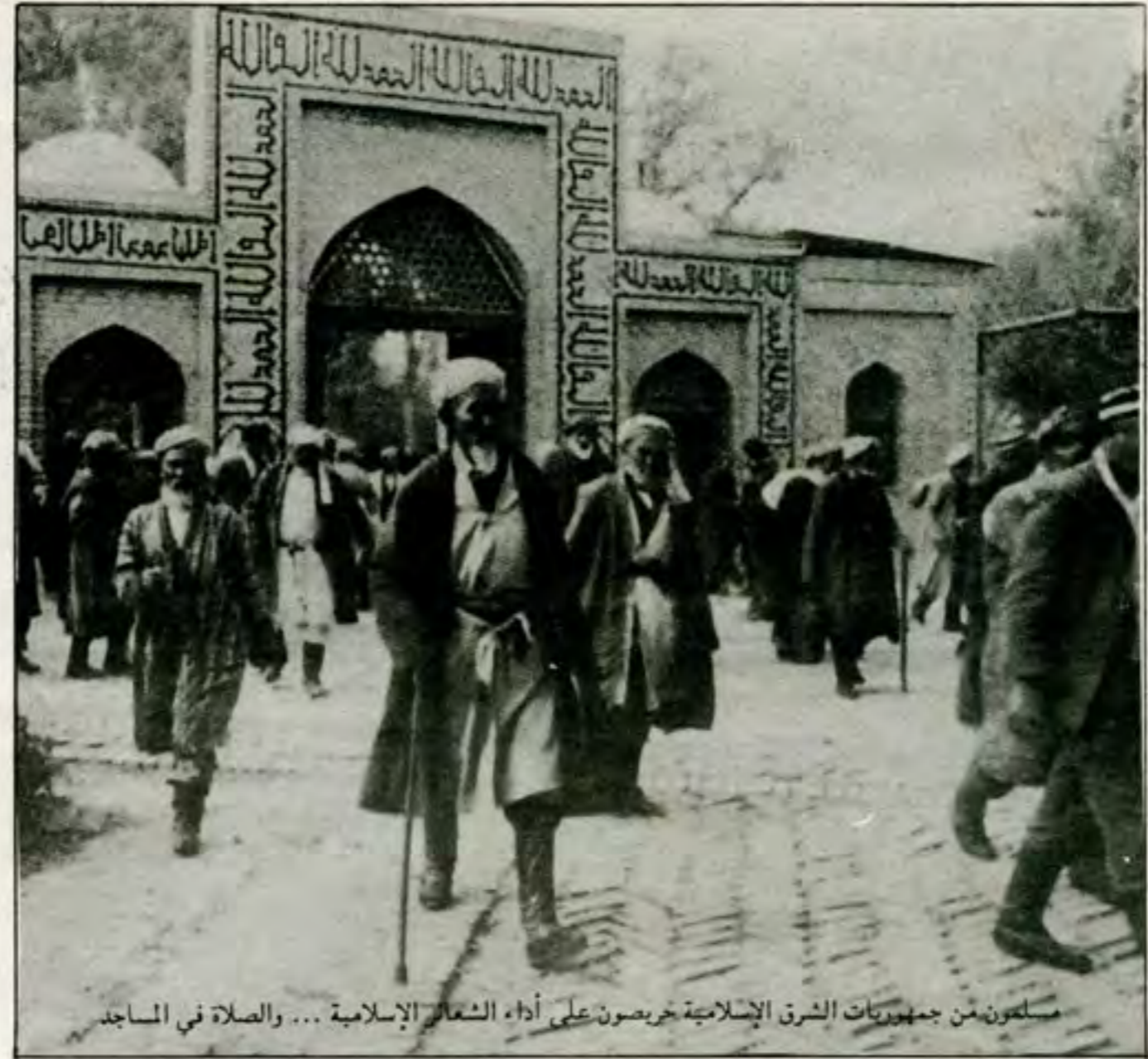
مسلمون من جمهوريات الشرق الإسلامية خريصون على أداء الشعائر الإسلامية ... والصلاة في المساجد

حساب ميثاق الرابطة 25201015549.01 وكالة بنك الوفاء حي أكدال رقم 83 شارع فال ولد عمير - الرباط