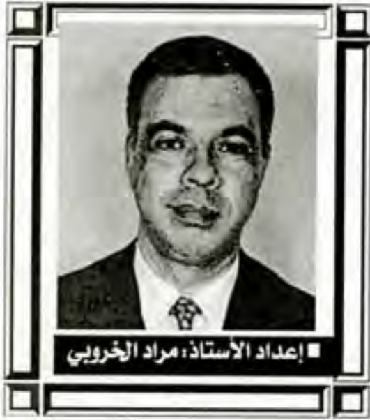
إعداد الأستاذ: مراد الخوري

وقد ورد في هذا المقال العلمي حديثا عن ذنب البجعة جاء فيه.