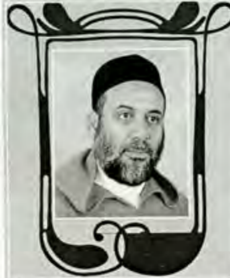
إعداد الأستاذ: عبد الله بوغوثة

عن أبي هريرة أن رسول الله صلى الله عليه وسلم قال: "إذا مات الإنسان انقطع عنه عمله إلا من ثلاثة إلا من صدقة جارية أو علم ينتفع به أو ولد صالح يدعو له" رواه مسلم.