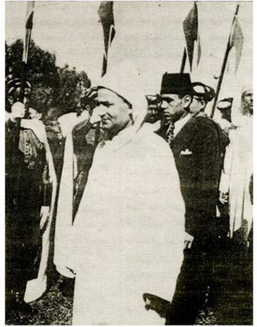
جلالة المغفور له أمير المؤمنين محمد الخامس وبجانبه صاحب السور الملكي ولي العهد مولاي الحسن ساعة اختراقه للحدود المصطنعة وطوله بمدينة أصيلا في طريقه إلى طنجة للقيام بزيارة الوحدة المحاللة، وهما يستعرضان في منظر مهيب أخاذ حرس الشرف المغربي المصطف لاستقبالهما.

في يوم 9 ابريل 1947 كانت «حركة الوحدة المغربية الاستقلالية» قد حرمت من لسانها العربي المبين «الوحدة المغربية»