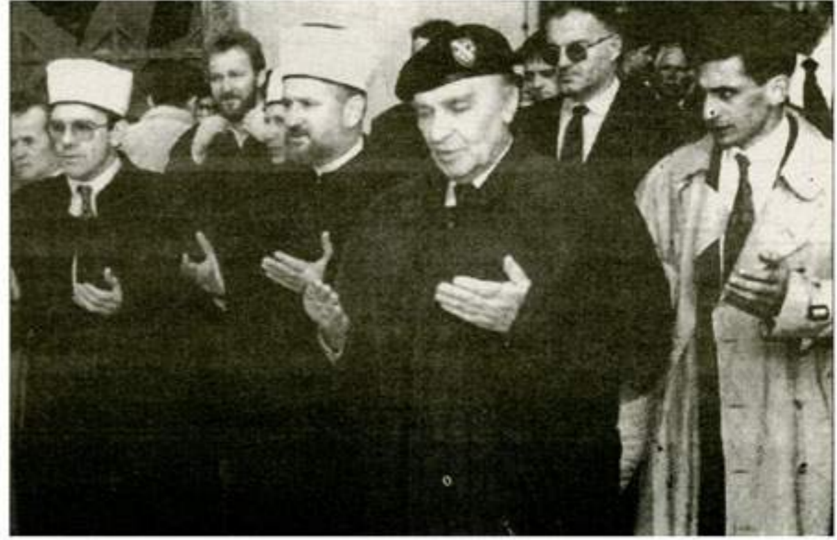
الرئيس على عزت بيكوفيتش يؤدي صلاة العيد مع جمع من البوسنيين في المسجد الرئيسي بالبحر القديم