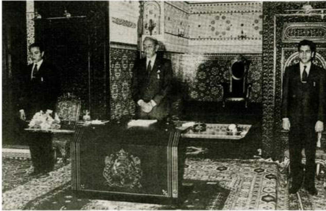
خطاب العرش ظاهرة مغربية أصيلة تجسم روح النواصل والتلاقي والحوار بين جلاله الملك وشعبه.

على مواصلة مهمتها الإشعاعية على مساحة هذه الخريطة. ان عيد العرش الذي تحتفل به الأمة المغربية اليوم هو عيد للتواصل والتلاقي المستمرين بين العرش والشعب.