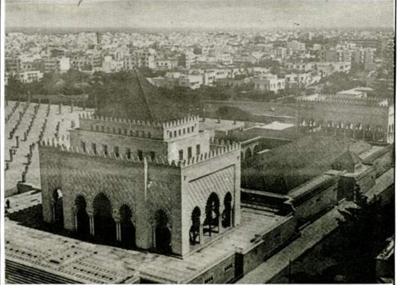
ضريح المغفور له جلالة الملك محمد الخامس ومسجد حسان