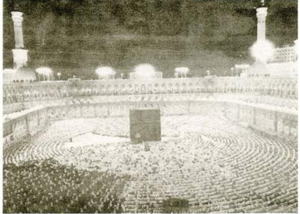
الحرم المكي الشريف بماذنه المهيبه التي ينبعث منها صوت الإسلام والسلام