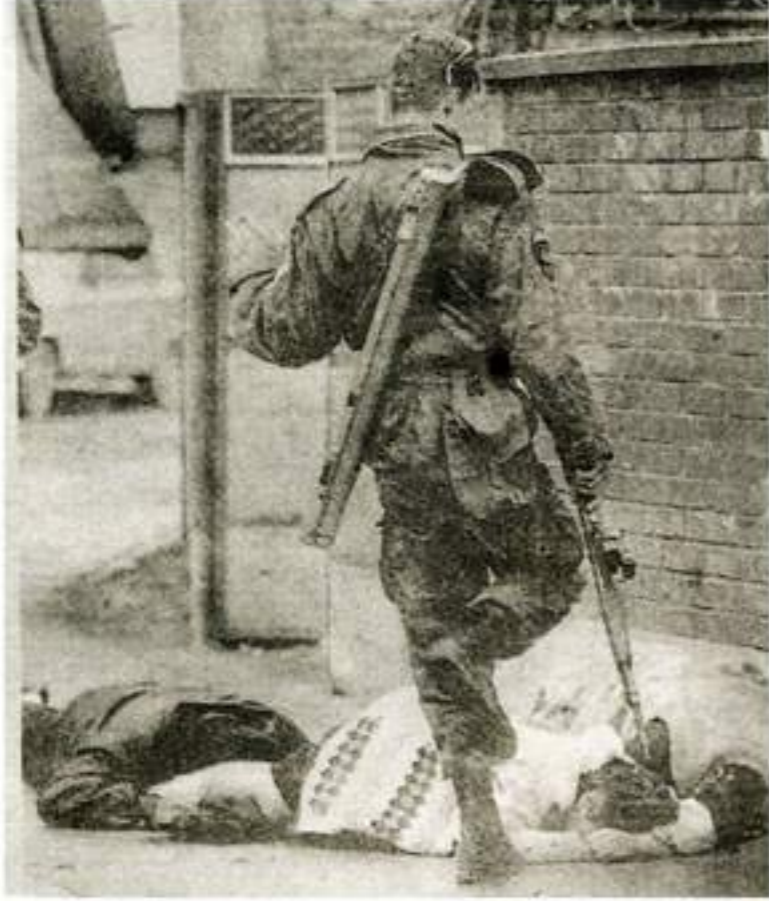
جرائم الوحوش الصربية ضد مسلمي البوسنة والهرسك. «قتل.. إهانة... وإذلال..»

أتاحت لي الدعوة الكريمة التي تلقيتها من «المنظمة الإسلامية للعلوم الطبية» بالكويت، بقصد حضور الندوة الفقهية الطبية في موضوع (رؤية إسلامية للمشاكل الاجتماعية) لمرض الأيدز «السيدا»، فرصة زيارة دولة الكويت الشقيقة من جديد، ولم أتردد إذ وصلتني الدعوة في قبولها بل شعرت برغبة جامعة تدفعني للرحيل رغم التعب الذي كنت أشعر به ومرد ذلك إلى شدة الحزن الذي يربطني بهذا القطر الشقيق من جهة، وإلى التصور الذي انطبع في ذهني عن هذه الدولة بعد الاجتياح من جهة ثانية، بحيث كنت أعتقد أن دولة الكويت قد تبذلت خارطتها وتغيرت معالم حياتها، هكذا كنت أتصور، لكن ما إن وطأت قدمي تربتها ووقعت عيني على ما قدر لها أن تعايينه منها، حتى تبددت تلك التخيلات والتصورات، إذ وجدت هذه الدولة كما عهدتها، حركة دائبة، ونشاط ملحوظ، وكان لا شيء وقع بالأمس، المؤسسات استأنفت سيرها المعتاد والشوارع المزدهمة والروجان الاقتصادي رجع إلى حالته الأولى، والاحسان الكويتي عاد إلى سالف عهده وهو أشد ما يكون حيوية ونشاطا، بحيث أن مركز الجمعية الإسلامية للعلوم الطبية الذي عقدت به جلستنا افتتاح واختتام الندوة بني من جديد على أحدث طراز، وبكل المرافق الضرورية والتكاملية والحسينية بعدما دمر القديم عن آخره كما قيل لنا. وهذا دليل واضح على حيوية ونشاط الشعب الكويتي الشقيق، وقدرته