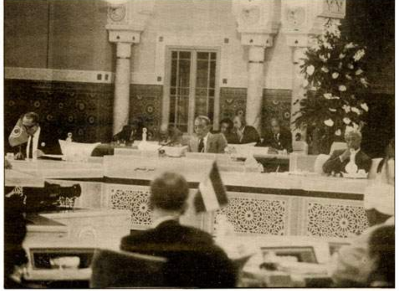
قمة الدار البيضاء الاستثنائية المساندة للقضية الفلسطينية (23-26 ماي 1989)