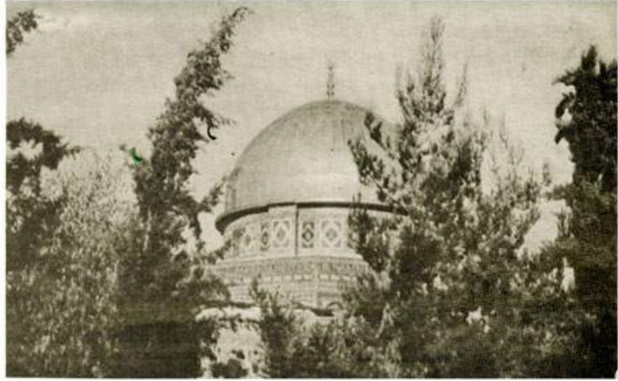
القبة الذهبية لمسجد الصخرة المشرفة بالقدس الشريف