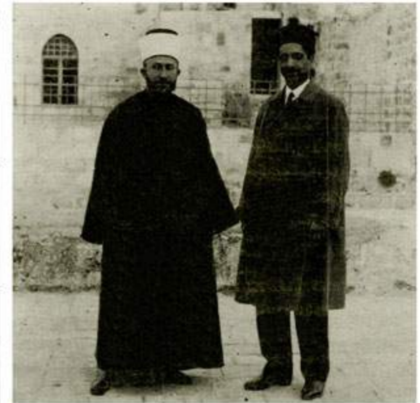
سماحة السيد محمد أمين الحسيني رئيس المؤتمر، والسيد ضياء الدين الطباطبائي وكيل المؤتمر.

ترأسه السيد محمد أمين الحسيني رئيس المجلس الإسلامي الأعلى ومفتي الديار المقدسية، وبجانبه السيد ضياء الدين الطباطبائي رئيس وزراء سابق لدولة إيران، ومحمد علي علوية باشا وزير سابق للأوقاف بمصر، ومحمد اقبال شاعر مسلمي الهند الأكبر، وشكري القوتلي ورياض الصلح اللذان أصبحا فيما بعد البغية ص 2