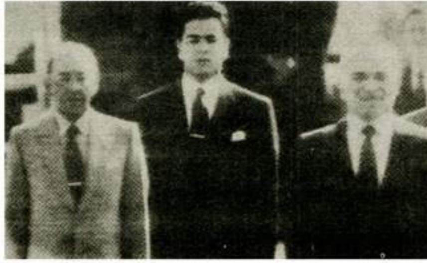
لسانممرار. وترضي عنه الاجيال القادمة.

لقاء العاهلين الكريمين جلالة الملك الحسن الثاني وجلالة الملك الحسين بن طلال