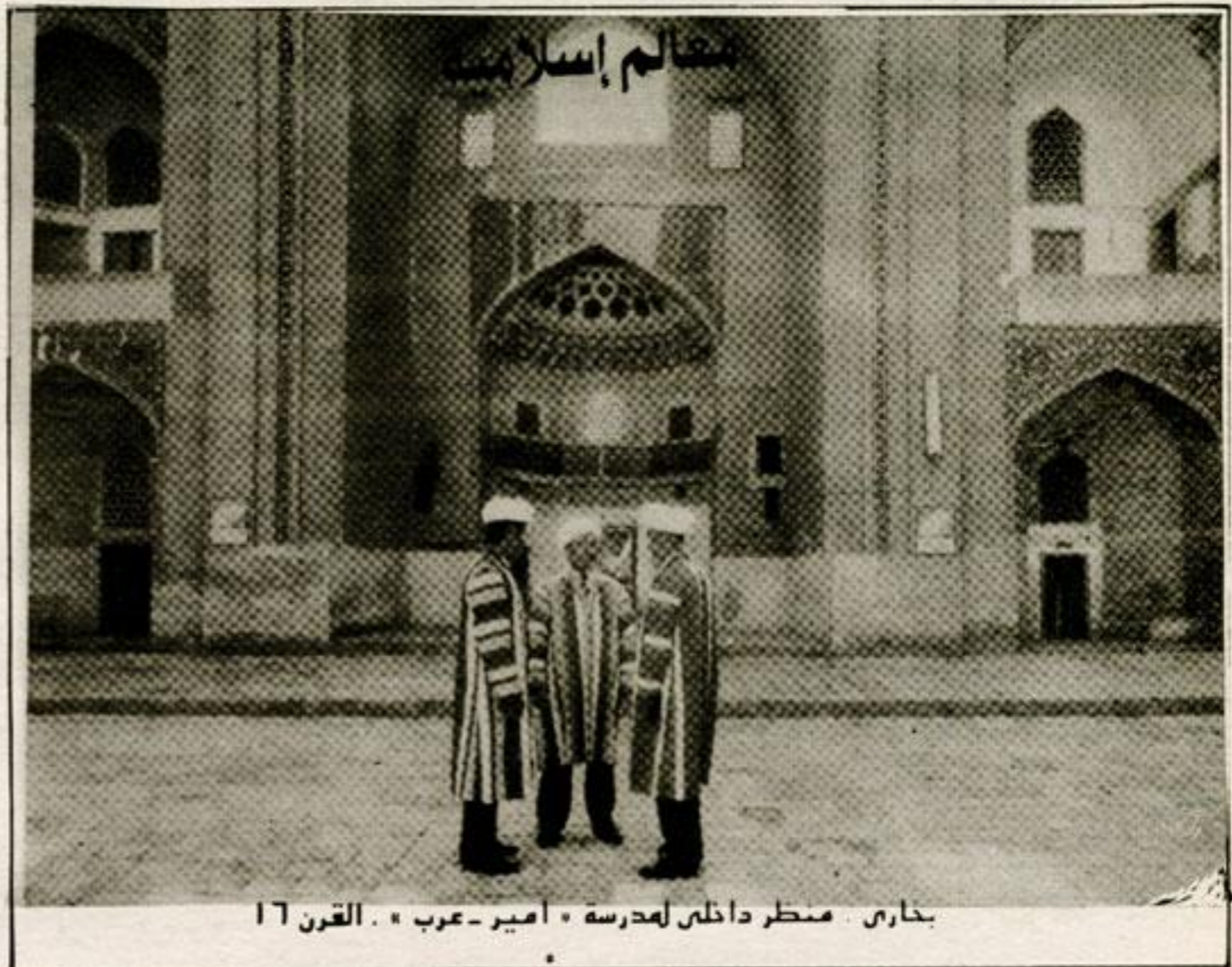
بخاري . منظر داخل مدرسة « امير - عرب » . القرن 17

وكالة بنك الوفاء حي أكدال رقم 83 شارع فال ولد عمير - الرباط