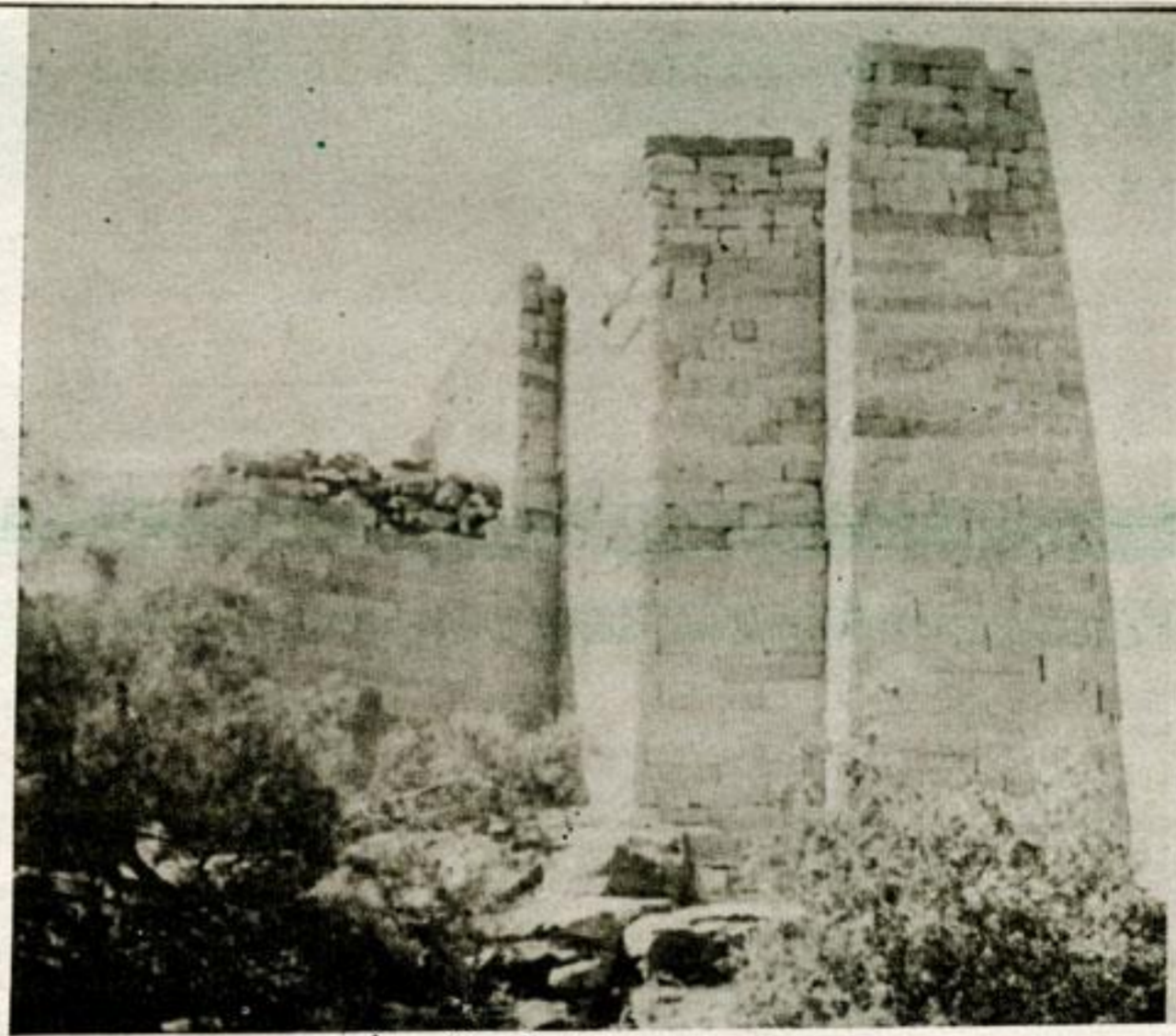
سد ما'رب حضارة وتاريخ