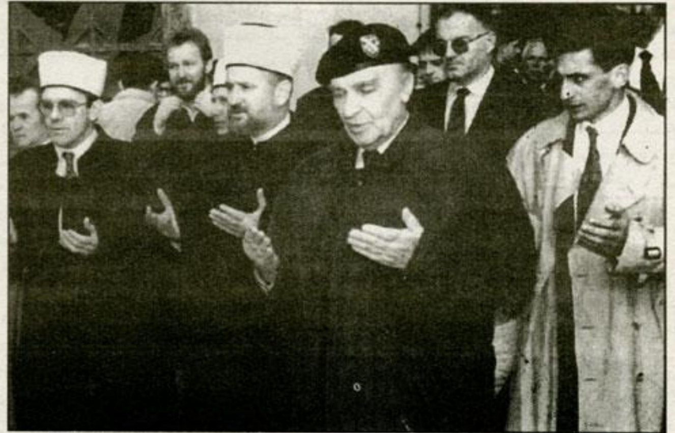
الرئيس على عزت بيكوفيتش يؤدي صلاة العيد مع جمع من البوسنيين في المسجد الرئيسي بالحى القديم