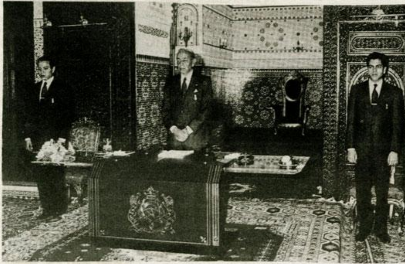
خطاب العرش ظاهرة مغربية اصيلة تجسم روح التواصل والتلاقي والحوار بين جلالة الملك وشعبه.

على مواصلة مهمتها الإشعاعية على مساحة هذه الخريطة. ان عيد العرش الذي تحتفل به الأمة المغربية اليوم هو عيد للتواصل والتلاقي المستمرين بين العرش والشعب.