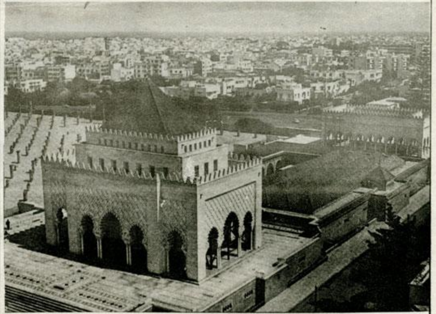
ضريح المغفور له جلالة الملك محمد الخامس ومسجد حسان