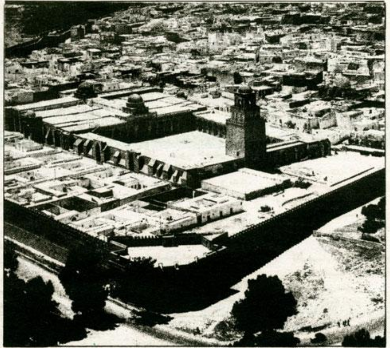
■ مسجد القيروان من أهم المعالم الاسلامية التي تحدثت عنها كتب الغربيين ■

قالت الحكماء : من أدب ولده رطبيا، وأغمز العود ما كان لدنا. صغيرا سر به كبيرا، وقالوا : من أدب ولده غم وقالوا : أطيع الطين ما كان حاسده.