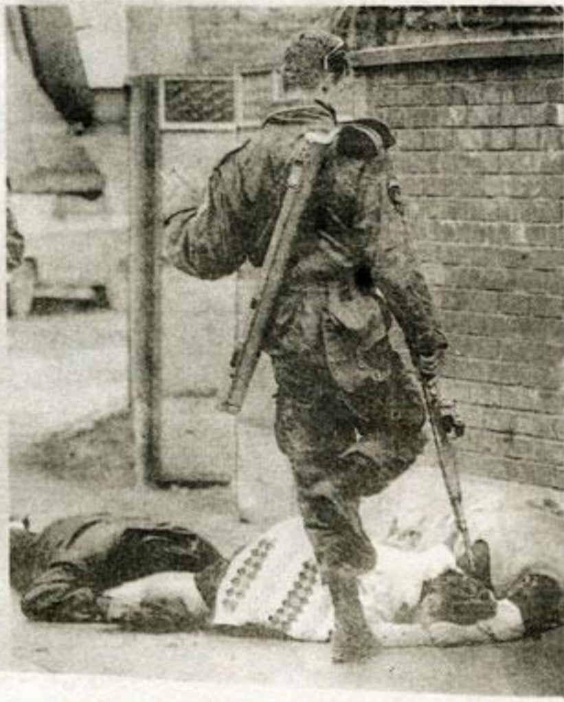
جرائم الوحوش الصربية ضد مسلمي البوسنة والهرسك. «قتل.. إهانة... وإذلال..»

عباد الله، كان المسلمون الأولون لا يهتمون بأعياد النصارى، ويكتفون بأعيادهم الإسلامية التي سنها لهم رسول الله ﷺ، أما اليوم فقد تغيرت