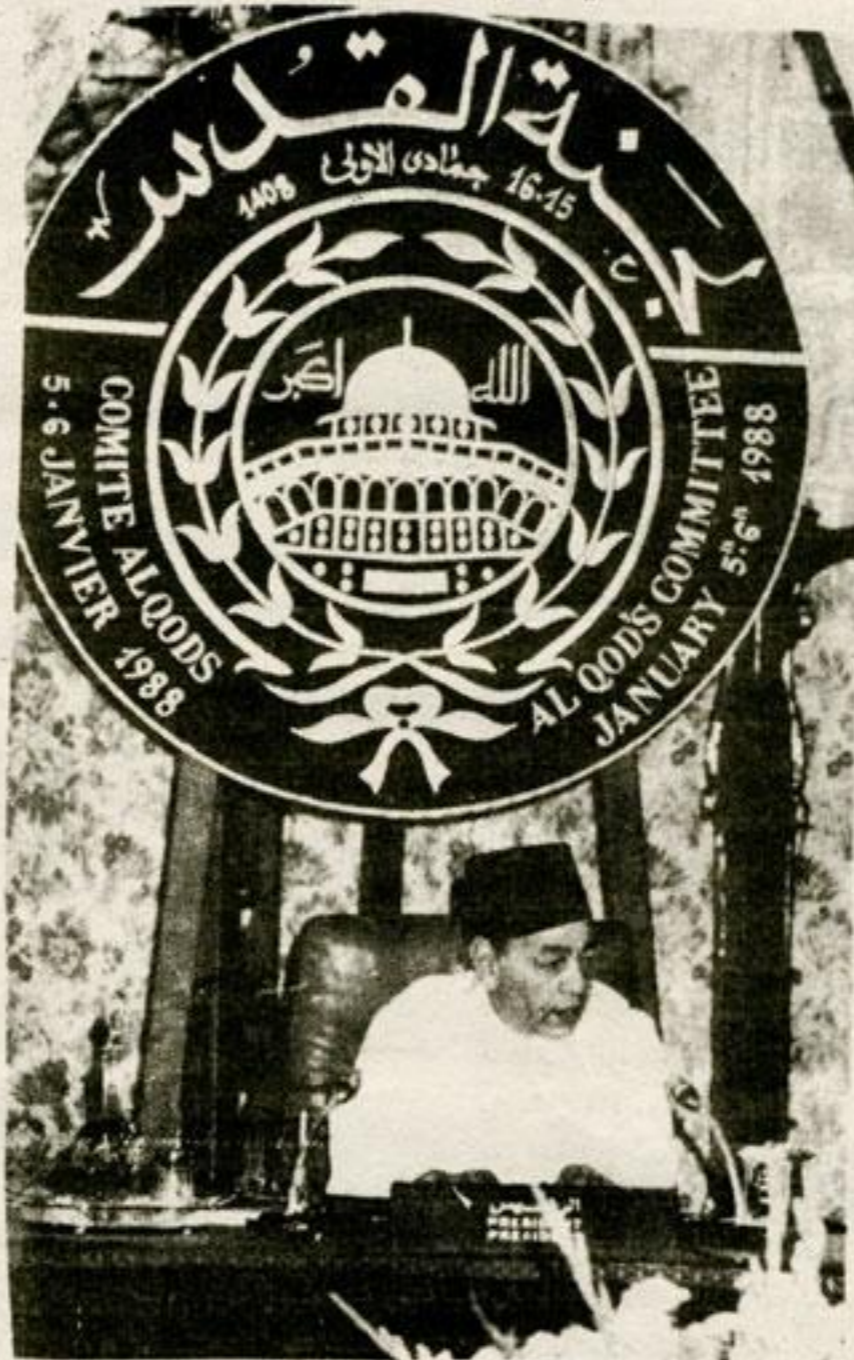
صاحب الجلالة رئيس لجنة القدس يترأس إحدى دورات لجنة القدس

ايها السادة ان ارتباط القدس بتاريخ الاسلام والمسلمين واحتوائها لتراث اسلامي اصيل كانا ولا يزالان وراء تعلق المسلمين بالقدس الشريف التي اليها اسرى الله بعبده نبينا سيدنا محمد عليه الصلاة والسلام ومن مسجدها الاقصى كان عروجه الى السماء وفي القدس يقوم المسجد الاقصى الذي بارك الله حوله وعظمه والى القدس كان المسلمون في بداية البعثة المحمدية يتوجهون بالصلاة قبله مقدسة قبل ان يحول الله القبلة الى المسجد الحرام بمكة المكرمة وجاء في الحديث الشريف لا تشد الرحال الا الى ثلاثة مساجد مسجدي هذا اي الحرم المدني والمسجد الحرام اي الحرم المكي والمسجد الاقصى. هكذا قامت عبادة المسلمين على الحج والزيارة والتقدیس الحج الى بيت الله الحرام وزيارة المسجد النبوي والصلاة في بيت المقدس