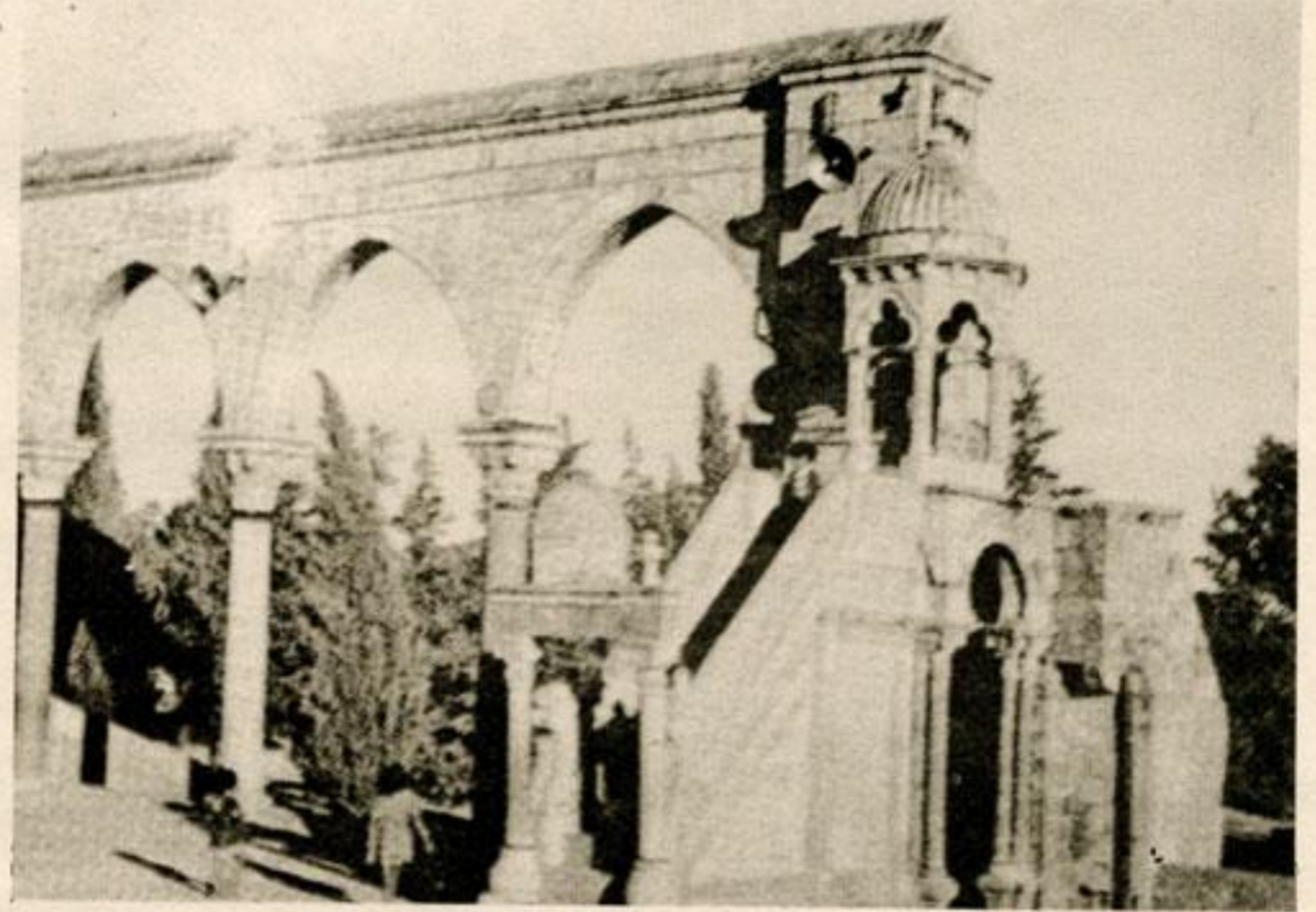
منبر برهان الدين الرخامي في ساحة الحرم القدسي الشريف ينتظر قادة المسلمين لاعتلائه والدعوة إلى الحق والعدل