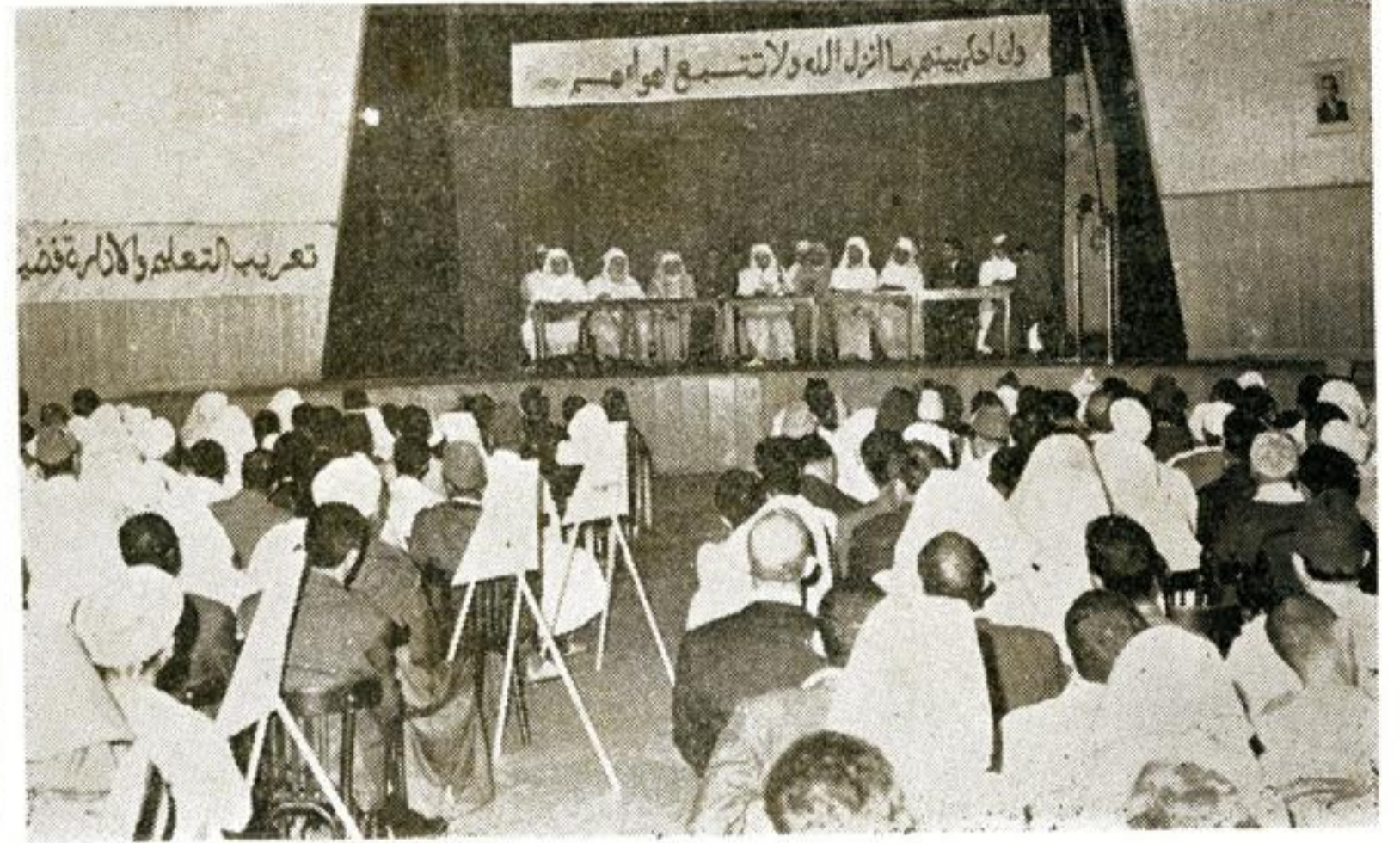
منظر من المؤتمر

عقد العلماء مؤتمريهم الثاني كما كان مقررا بالدار البيضاء في فاتح ربيع الاول وثانيه وثالثه من عام 1384 - 11، 12، 13 من يولييه 1964. وقد كان حقا مظهرة اسلامية كبرى وفرصة اتاحت للعلماء التعبير عن ارائهم في كل ما يهمهم من شؤون البلاد وما يجري فيها من احداث.